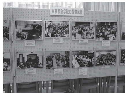
写真3 授業風景写真