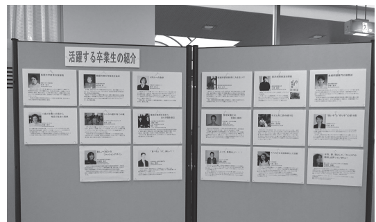
写真5 活躍する卒業生紹介