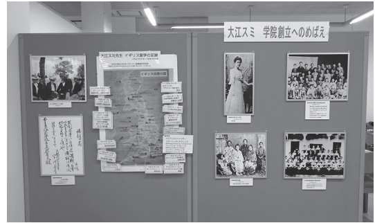
写真2 大江先生の生い立ち